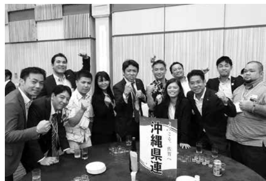
大懇親会スタート前にボーボーMAX