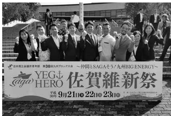
九州ブロック大会会場前にて

ツアーに参加した会員はこれからのYEG活動に大いに刺激になり、よい経験となりました！