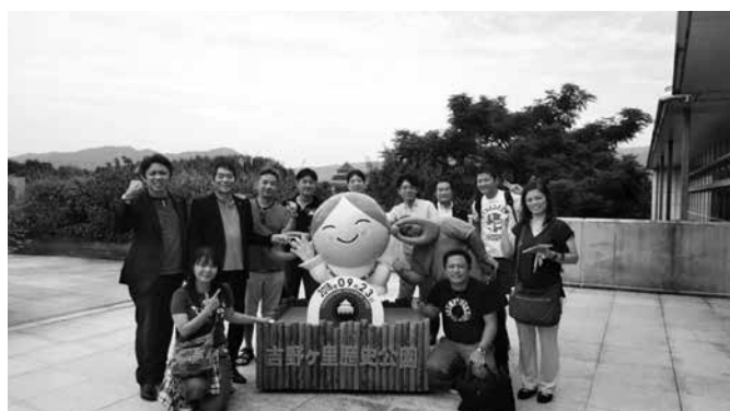
吉野ヶ里歴史公園ではしっかり歴史も学びました