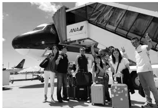
出発直前の那覇空港にて