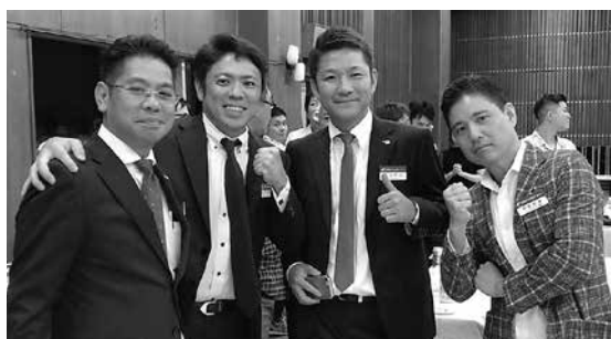
懇親の部でリラックス