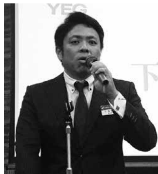
下地会長による挨拶