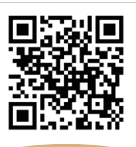
公式ホームページQR