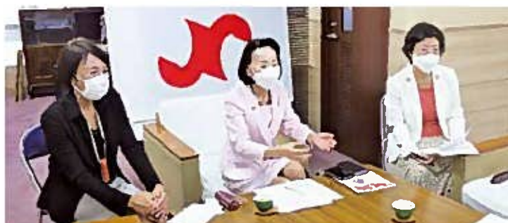
オンライン交流会の様子