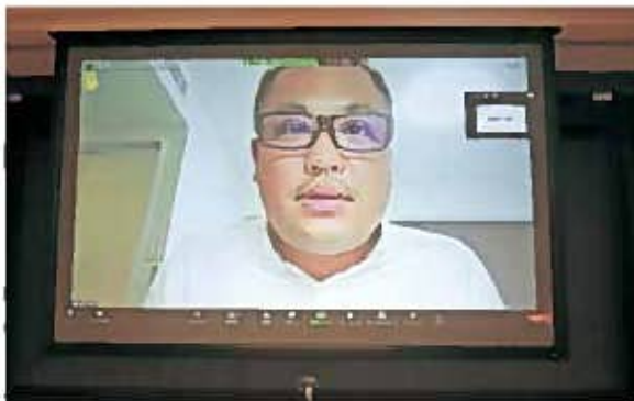
委員会報告(New Business 委員会)