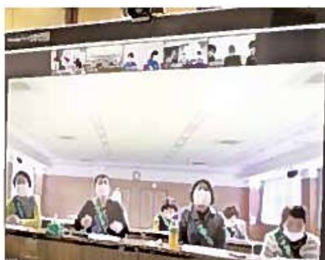
オンライン交流会

来年は、第五十四回全国商工会議所女性会連合会福島総会として現地開催を予定しております。こちらも多くのご参加をお願いいたします。