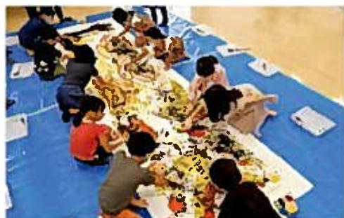
夏休み！子どもフェスタ2021