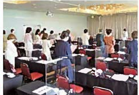
女性会の歌静聴の様子