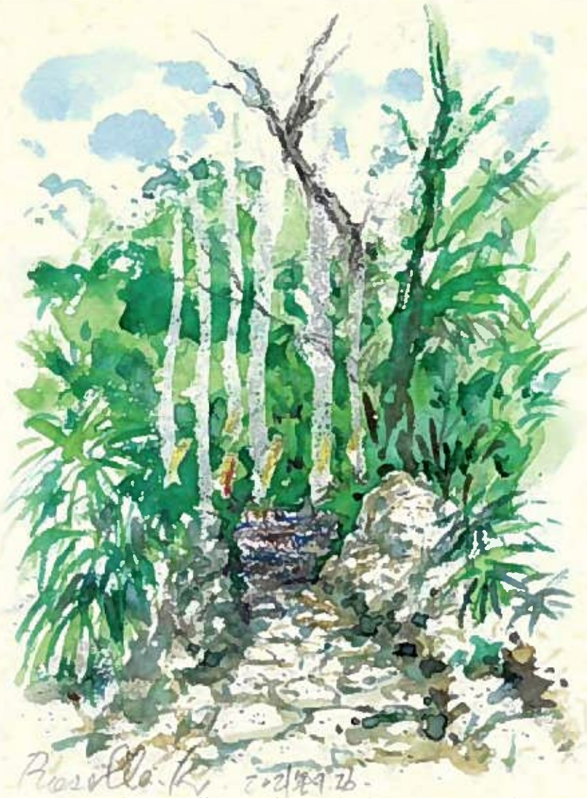
南城市(旧玉城村)の富里・富山は巨岩と森に囲まれた古の集落、第一尚氏のゆかりの史跡が点在している。