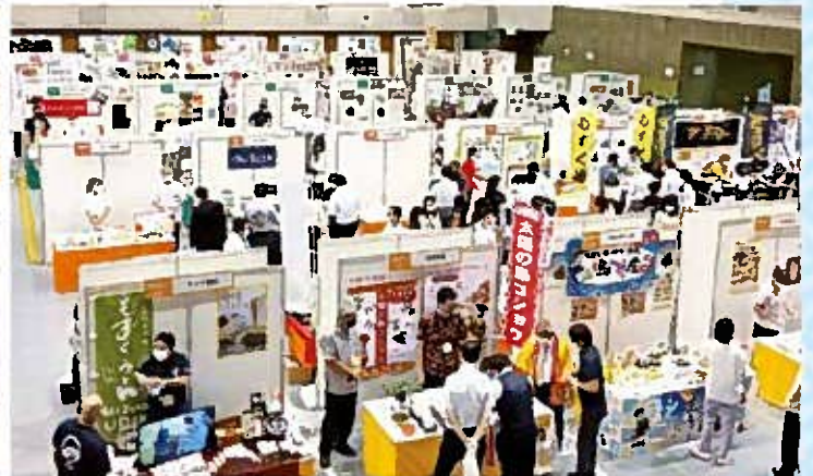
展示試食会の様子