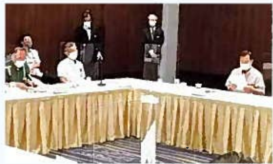
西銘沖縄担当大臣との意見交換の様子②