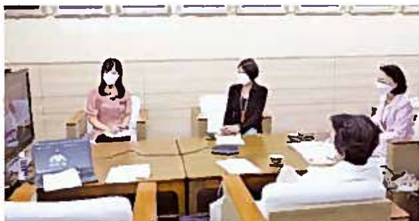
オンライン総会視聴の様子