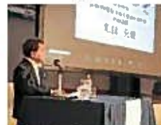
ファシリテーター