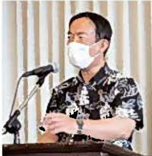
山城頭取によるご講演