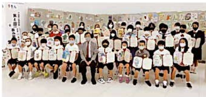
アートコンクール2020