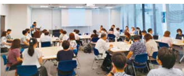
活発に意見交換を行う参加者

定例会第一部のグループディスカッションでは「健康経営における従業員の巻き込み方」と題し、①自社で取り組んでいることの紹介、②これから試してみたい施策、③実施している中での課題、④まだ取り組んでいないが不安に感じていることなどについて意見を交換しました。参加事業所では、7,000歩運動を行っており、達成者には健康グッズなどをプレゼントして従業員が自発的に運動する取り組みを行っている他、従業員が二次健康診断を受診しやすくするために特別休暇付与や企業が費用負担を行っている事業所もあり、非常に参考になるお話がされていました。