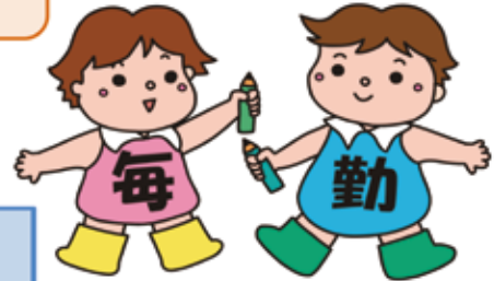
毎月勤労統計調査のキャラクター「まいちゃん きんちゃん」

調査の結果は、 景気の判断や、 社会保障制度を 検討するときの 資料として使わ れます。