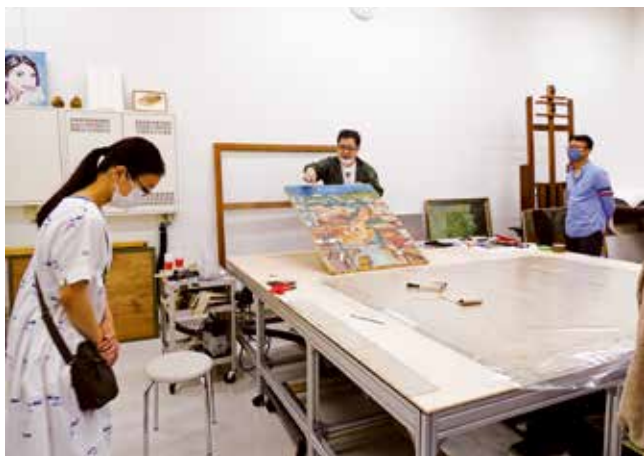
バックヤードツアーにて(筆者真ん中)

残ってきた作品をモノとして読み解こうとするとき、美術品はまた別の顔をもつて、誰がいつ、何に描いたのか。使用したのは油絵具なのかアクリルなのか、水彩なのか複数の絵具を混ぜたものか。修復は既に行われているのか。損傷や劣化があれば、それができた理由は何なのか、保管されていた場所の問題なのか、組成自体に原因があるのか。作