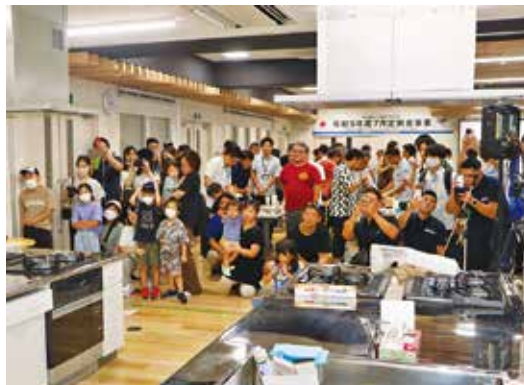
解体ショーの様子②