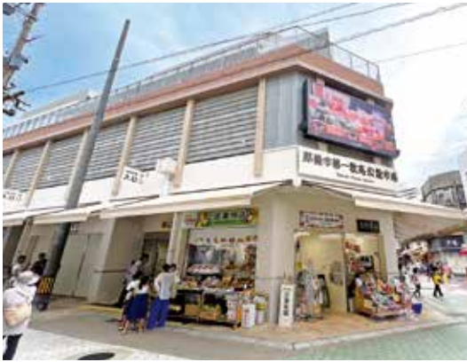
第一牧志公設市場

今回の定例会は、今年3月にオープンした第一牧志公設市場内3階にある多目的室を利用して行われました。冒頭には大宮見会長より、「7月も半ばに差し掛かり、猛暑日が続いております。熱中症の症例も各地