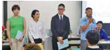
新入会員の皆さん