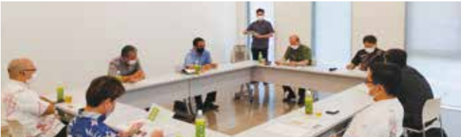
情報提供「健康経営について」