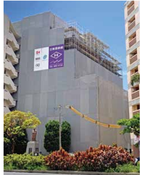
中小企業振興会館外観建設の様子