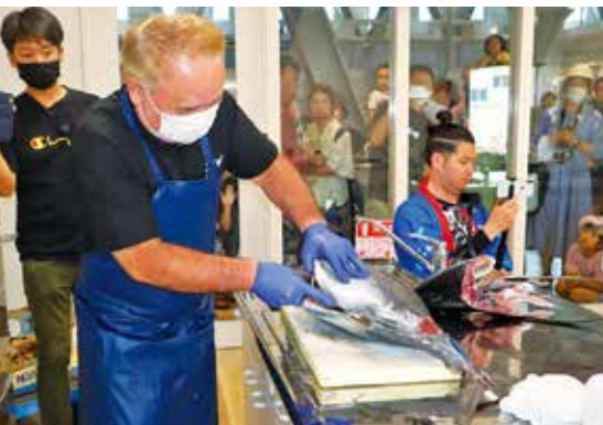
解体ショーの様子①