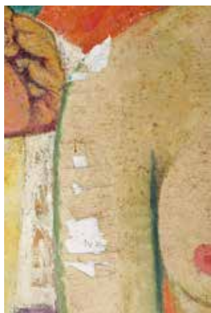
腕部分・剥落(修復前)