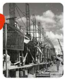
1963年建設中の様子