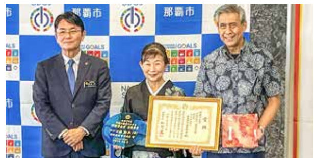
非食品の部最優秀賞～(有)首里琉染～

令和7年度の那覇市長賞の受賞者はすべて那覇商工会議所の会員事業所でした。当所としては、今後も会員事業者に寄り添った支援を継続し、地域ブランドの向上と販路拡大に取り組んでまいります。本賞の受賞によって、那覇発の商品がさらに広く認知され、地域経済の活性化につながることを期待致します。