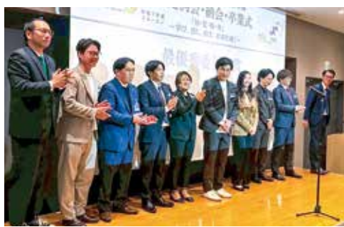
最優秀委員会賞 研修委員会

に満ちた空気に包まれました。一人ひとりの言葉には重みがあり、その背中がこれまで築いてきた時間の深さを物語っていました。