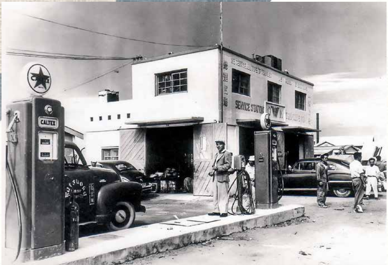
沖縄のガソリンスタンド第1号「OKスタンド」(1950年代)