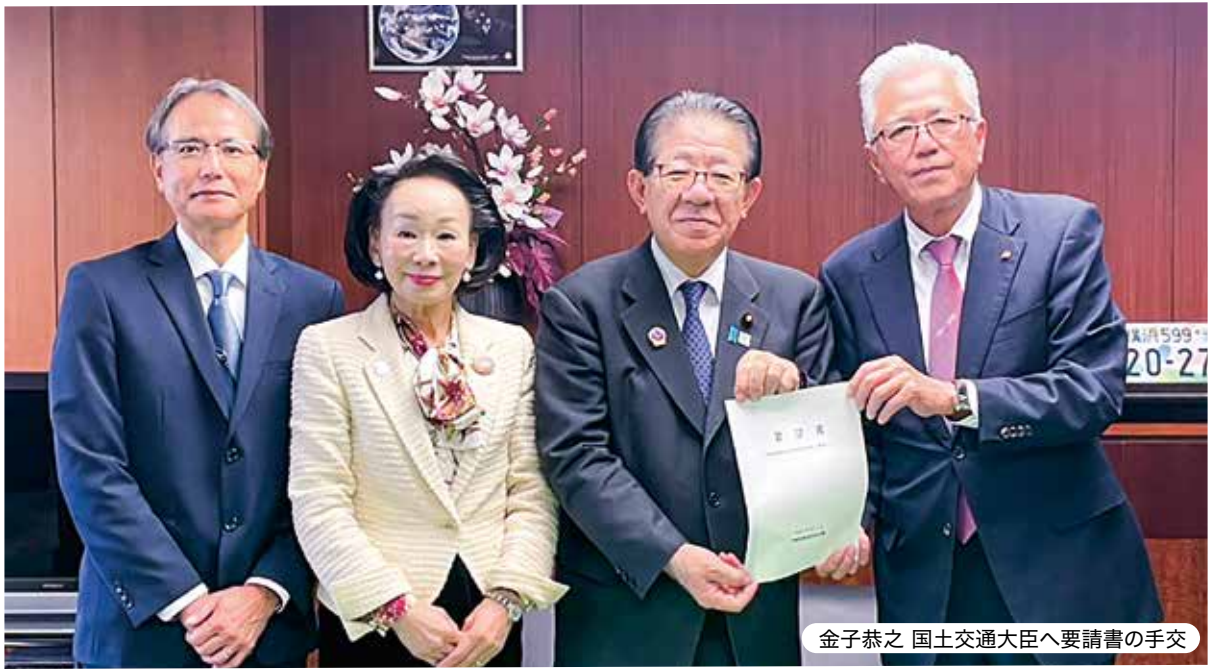
金子恭之 国土交通大臣へ要請書の手交