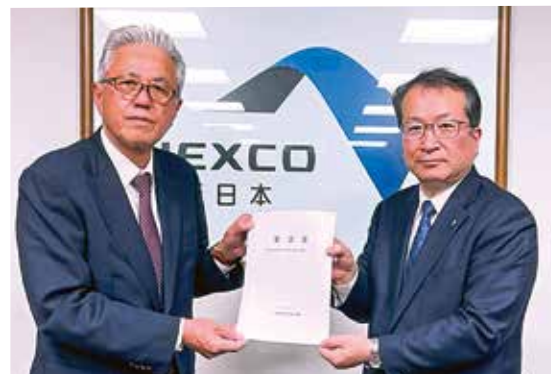
NEXCO 西日本へ要請書の手交