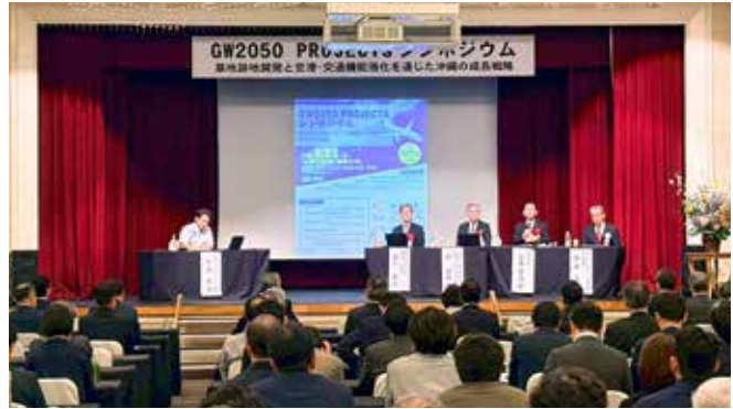
シンポジウム講演・パネルディスカッションの様子

3月23日(月)、那覇市のロワジールホテル那覇にて「GW2050 PROJECTSシンポジウム」が開催されました。本プロジェクトは、基地返還跡地の一体的利用と那覇空港の機能強化を軸に、2050年を見据えた沖縄の自立型経済を目指す取り組みです。