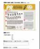
記入フォームイメージ