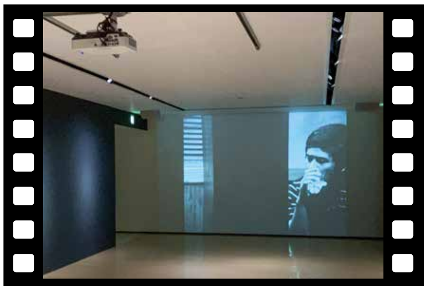
デジタル化事業成果作品 東陽一『やさしいっぽん人』(美術館コレクションギャラリー1)