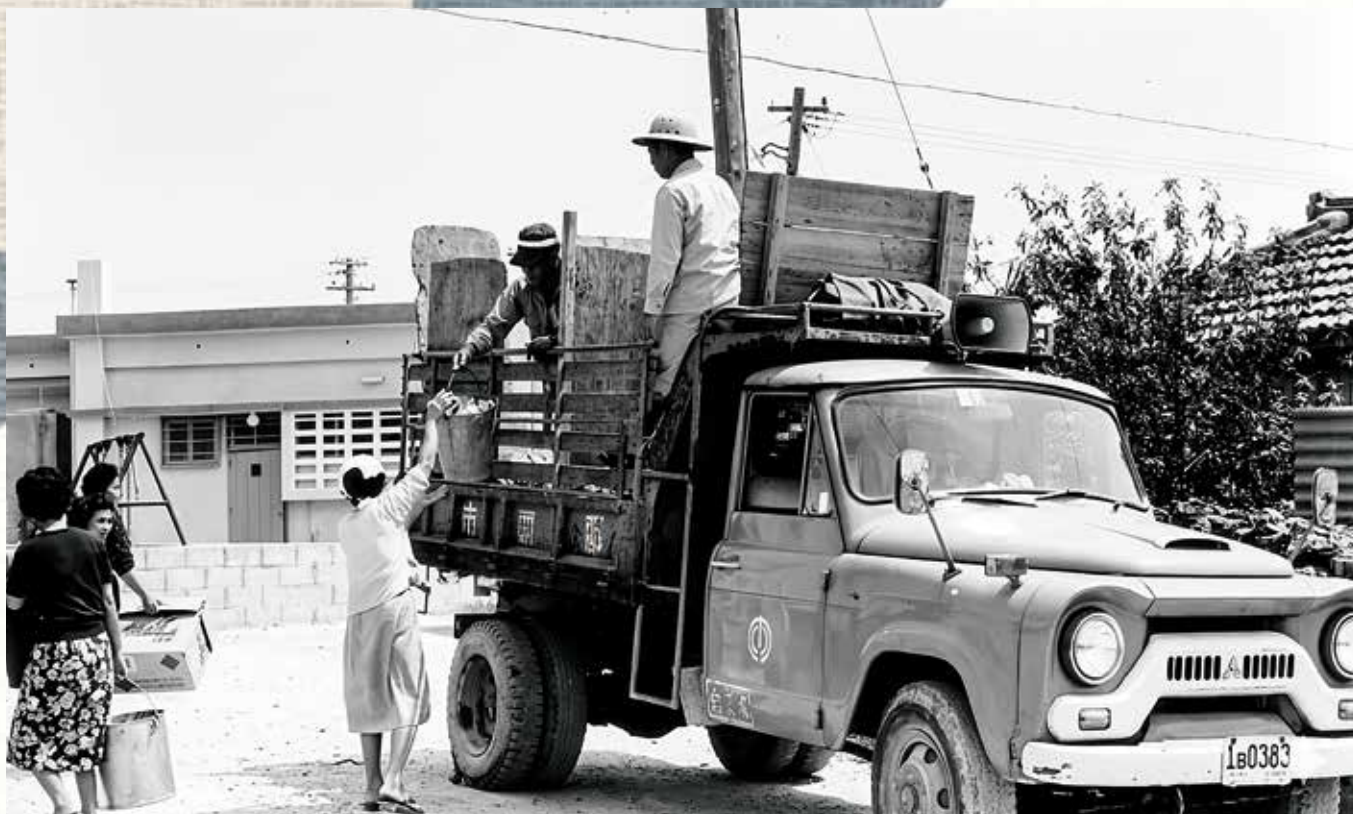
1960年代頃の那覇市内。スピーカーを搭載したトラックの荷台上、住民がバケツで直接ごみを投入している様子。当時の生活感と、人々の協力体制がよくわかる貴重な一コマである。