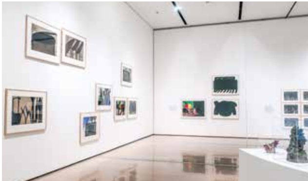
第1章「色と形をおいかけ」展示風景