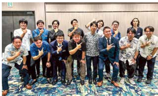
今回事業を担当した会員交流・支援委員会

ローガンである「YEG MOVE・MENT」は未来はここから始まる「の精神のもと、地域経済の発展に向けて一丸となって邁進してまいります。 結びに、本事業ならびに懇親会の企画運営を一手に担い、最高の交流の場を提供して下さった会員交流・支援委員会の皆さま、ご参加いただきました皆さま、本当にお疲れ様でした。 引き続き那覇商工会議所青年部へのご指導・鞭撻を賜りますよう、何卒宜しくお願い申し上げます。