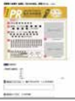
記入フォームイメージ