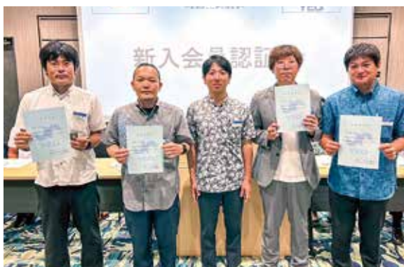
新入会員のみなさん

続く委員会ごとの「ハイアンドローゲーム」では、緊張感のほぐれたメンバー同士の活発なコミュニケーションが行われ、終始にぎやかな熱