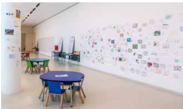
来館者が制作した作品等の展示