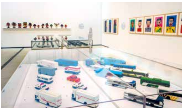
第4章「社会の密林へ」展示風景