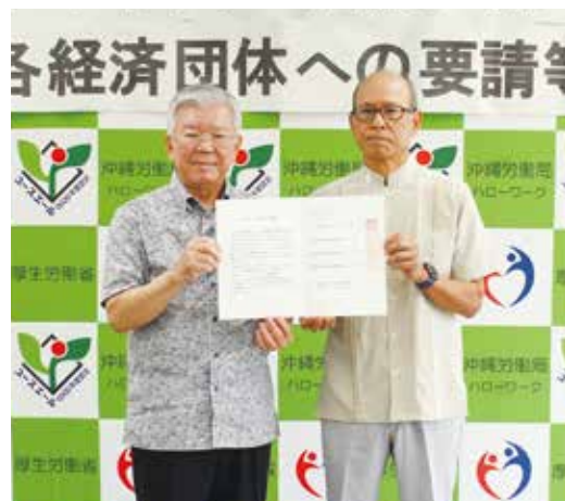
経済界を代表して要請に応じる沖縄県経営者協会 宮城会長